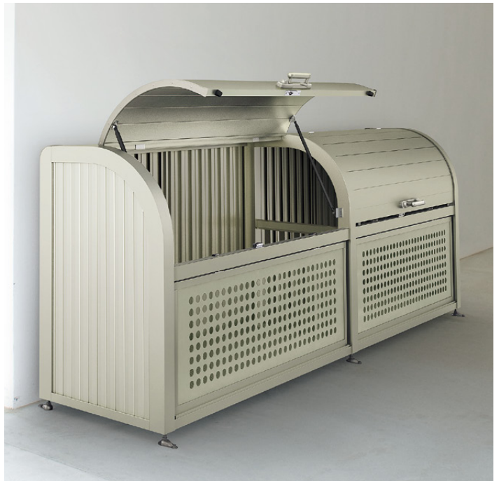
基本セット+連棟ユニット (1812-07サイズ)