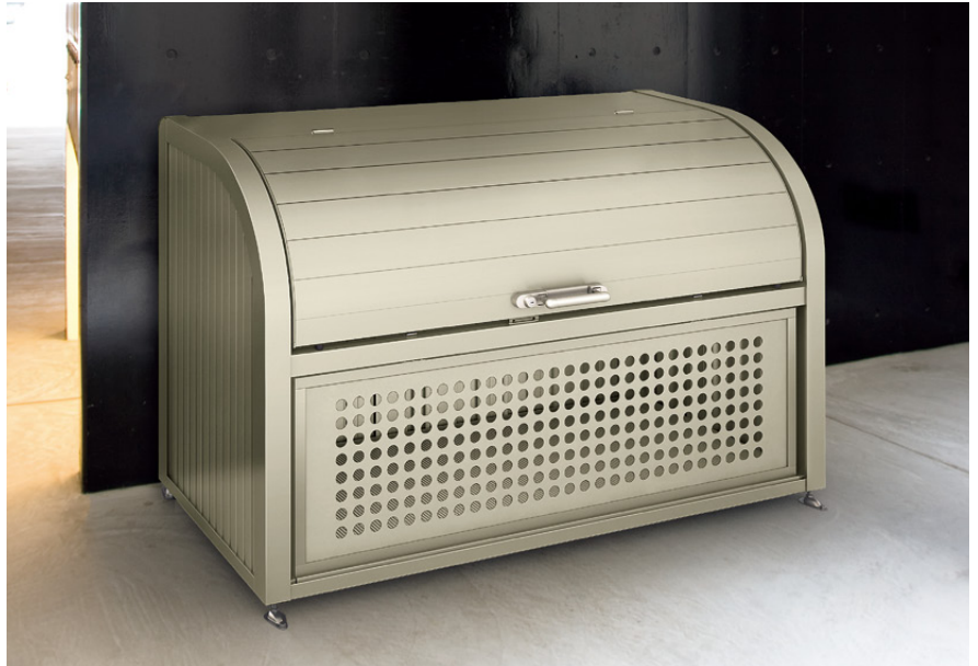
基本セット (1812-08サイズ)